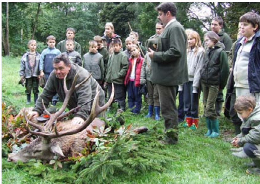
Vadászavattás bemutatása az ifjúság számára

- az avatópalcát vagy pálcákat megbecsült vadászati ereklyeként megőrizni, trófeaként kezelni.