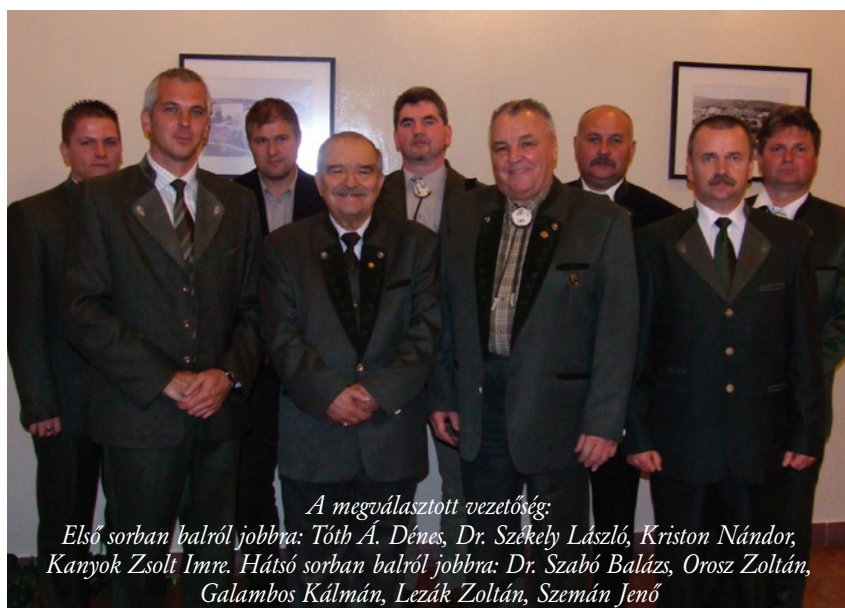
A megválasztott vezetőség: